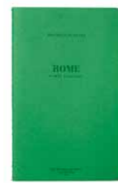
ROME by Pierre Ricardou www.pierre-ricardou.com