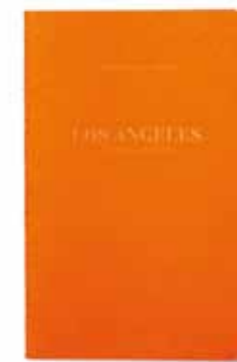
LOS ANGELES by Vincent Mercier www.vincent-mercier.fr