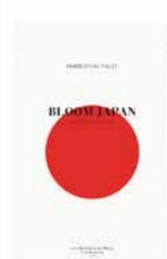
BLOOM JAPAN by Frédéric Lebain