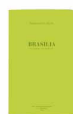
BRASILIA by Vincent Fournier