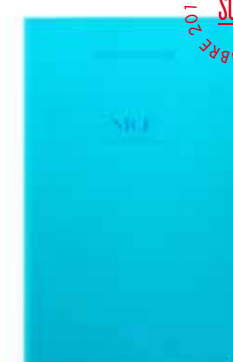
NICE by Jean-Robert Franco