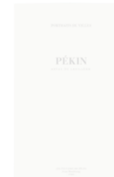
PEKIN by Artus de Lavilléon www.artusdelavilleon.com