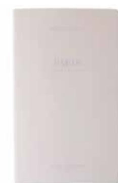
PARIS by Patrick Messina www.patrickmessina.com