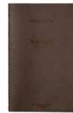
NAPLES by Vanessa Altan www.vanessa-atlan.com