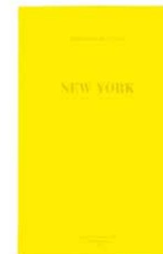
NEW YORK by Steve Hiett www.artsphere.fr