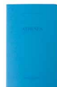
ATHÈNES by Evangelia Kranioti www.evangeliakranioti.com