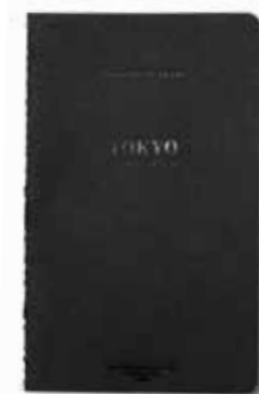
TOKYO by Fred Lebain www.propice.com