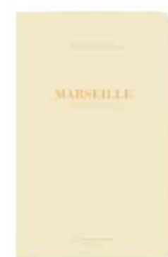
MARSEILLE by Olivier Amsellem