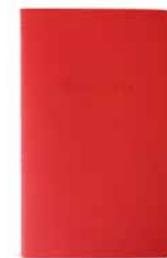
REYKJAVIK by Martin Bruno www.martinbruno.fr