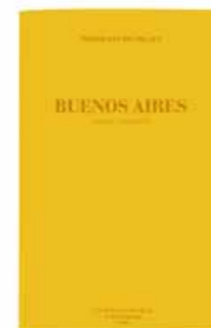
BUENOS AIRES by Jacques Borgetto