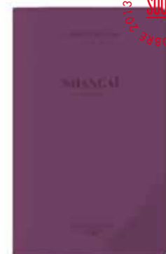
SHANGAÏ by Liz Hingley