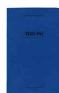
TBILISI by Vincent Lappartient