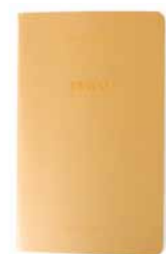
DUBAÏ by Philippe Chancel www.philippechancel.com