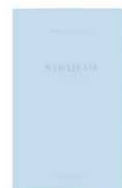
SARAJEVO by Lina Scheynius www.linascheynius.com